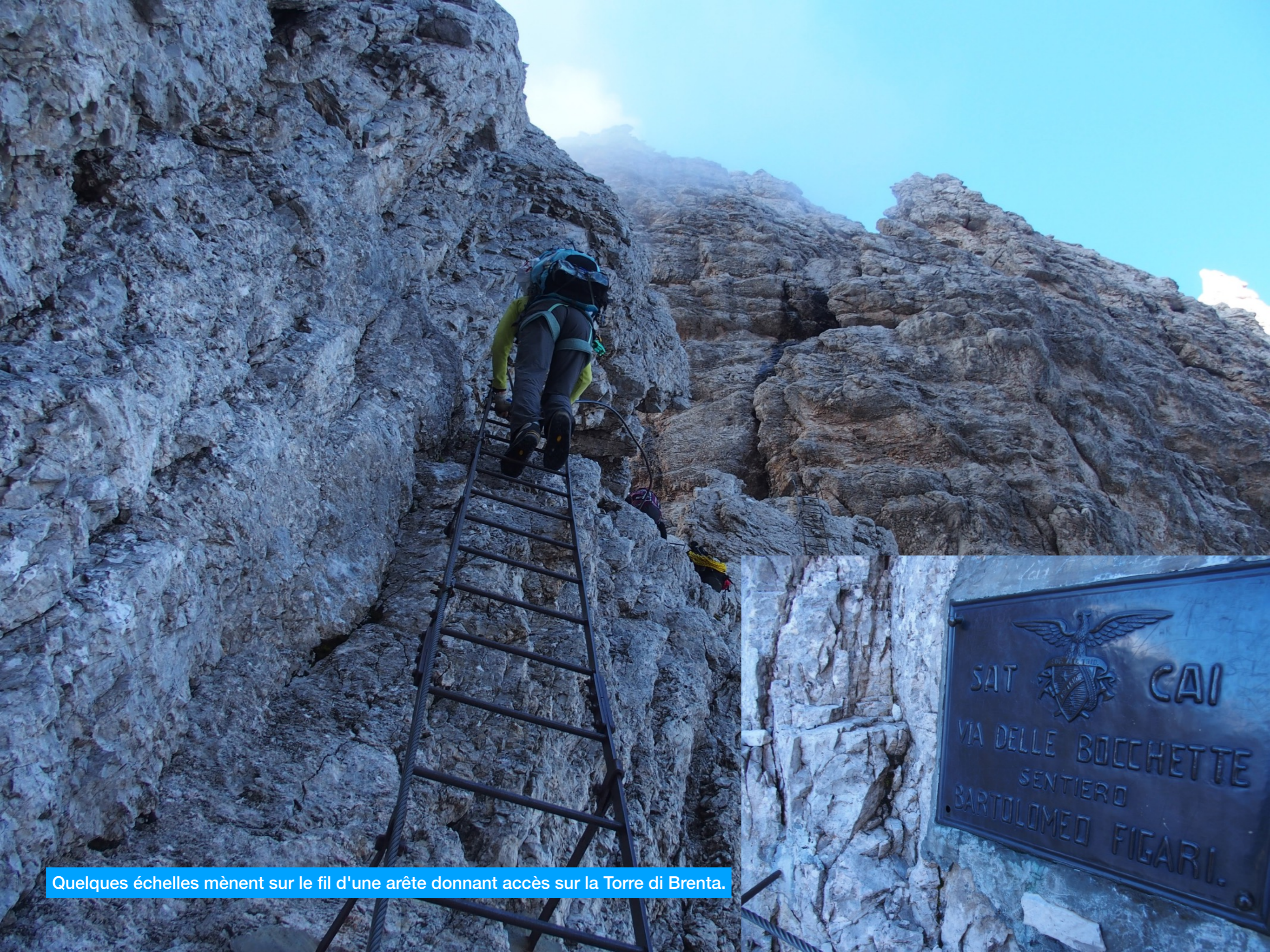
Quelques échelles mènent sur le fil d'une arête donnant accès sur la Torre di Brenta.