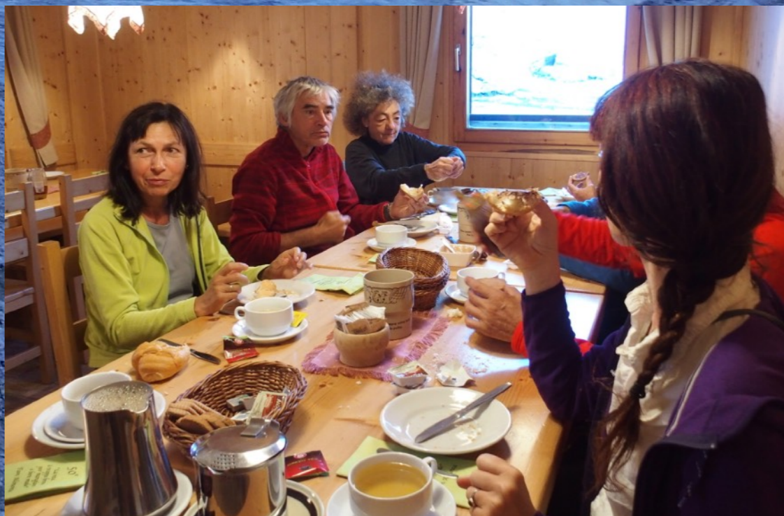
Petit-déjeuner sympathique alors que d'autre sont déjà en route